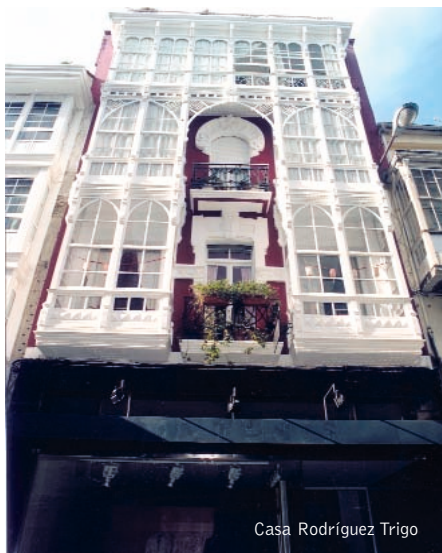
Casa Rodríguez Trigo

Edificación que ocupa la parcela de una esquina de la manzana. Destaca la verticalidad que alcanzan sus plantas. En la fachada se articulan distintos vanos con sus respectivos balcones de estructura en hierro forjado. Es reseñable la fusión de líneas curvas con líneas rectas en su composición. Esta obra fue construida durante los años veinte por el arquitecto Rodolfo Ucha Piñeiro.