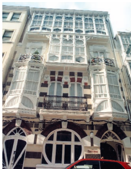
Casa Pereira 1

proyecciones que le da a sus construcciones, haciendo que cada una de ellas sea única e irrepetible, buscando la singularidad en cada edificación. Con la aparición de las ideas racionalistas y geométricas abanderadas por la Bauhaus, Ucha Piñeiro sufre una reconversión evolucionando hacia un racionalismo estético, abandonando las típicas galerías y sustituyéndolas por voladizos de hormigón.